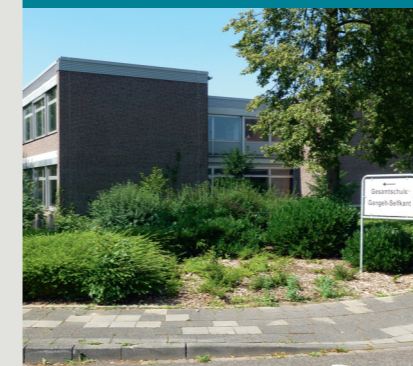
Ausbau der Gesamtschule Gangelt-Selfkant