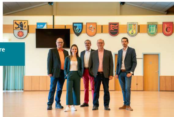
Einsatz für unsere Ortsvereine