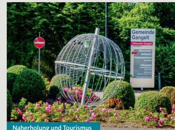
Naherholung und Tourismus