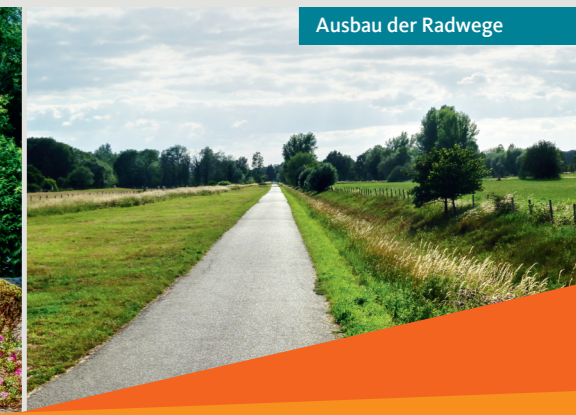
Ausbau der Radwege

Mit vollem Einsatz werden wir weiter am Erhalt und der Verbesserung unserer Strukturen arbeiten. Unsere Mischung für Gangelt besteht aus jungen und erfahrenen Frauen und Männern, denen die Zukunft unserer Gemeinde am Herzen liegt. Nur mit Ihrer Stimme können wir unsere Ziele für Sie umsetzen.