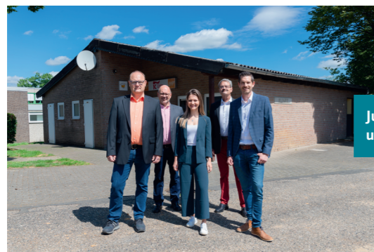
Jugend fördern und unterstützen