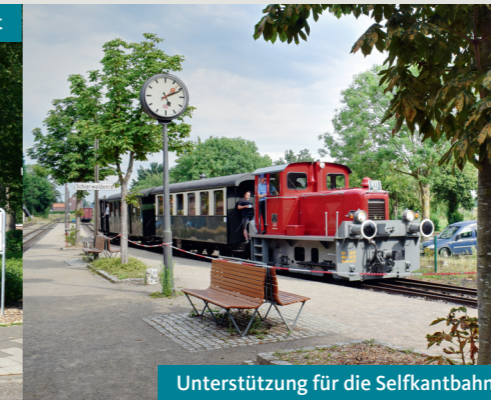
Unterstützung für die Selfkantbahn