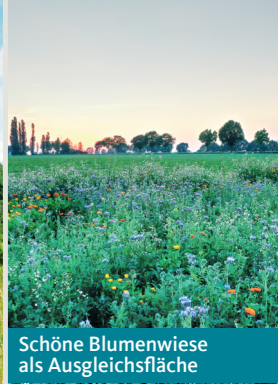
Schöne Blumenwiese als Ausgleichsfläche