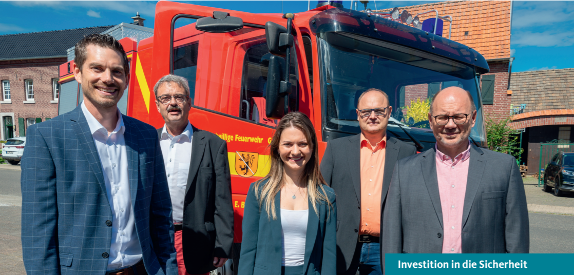
Investition in die Sicherheit