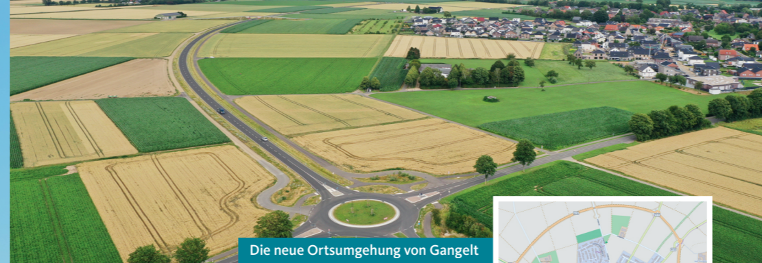
Die neue Ortsumgehung von Gangelt

Bei der Kommunalwahl am 13. September 2020 freuen wir uns über Ihre Stimme, damit wir weiterhin für eine ortsnahe, bürger- und umweltfreundliche sowie zukunftsorientierte Politik sorgen können.