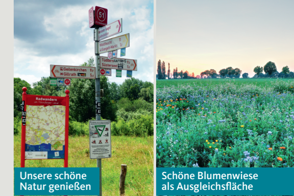
Unsere schöne Natur genießen