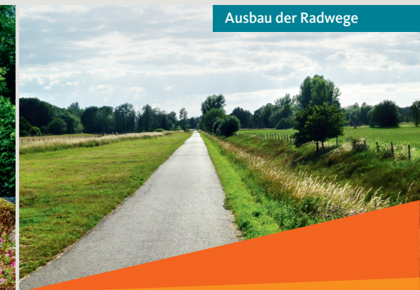
Ausbau der Radwege