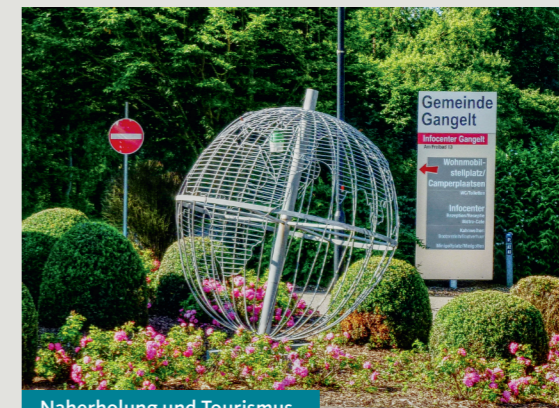
Naherholung und Tourismus