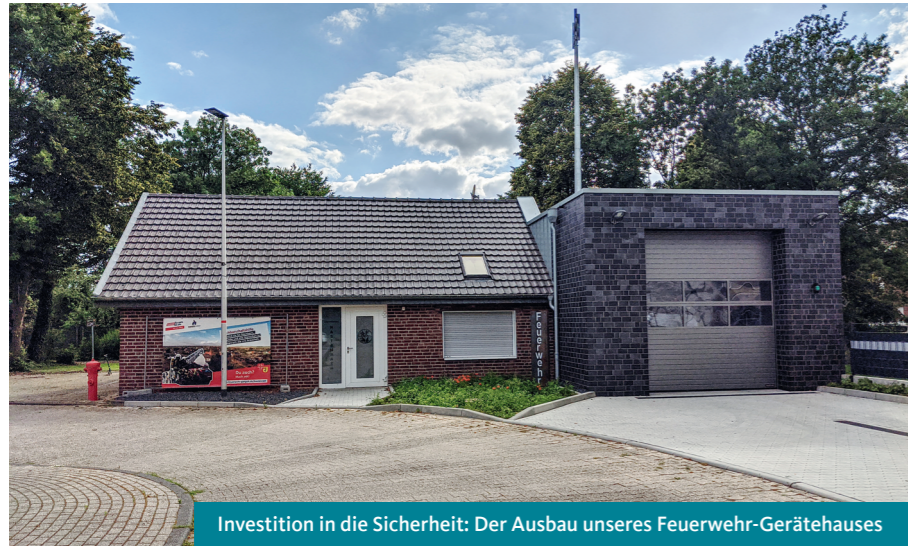
Investition in die Sicherheit: Der Ausbau unseres Feuerwehr-Gerätehauses

Wohnraum schaffen: Das Neubaugebiet »Hinter dem Kamp« steht in den Startlöchern