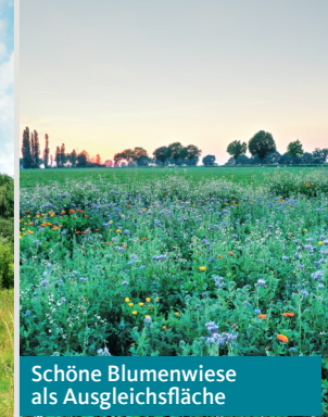
Schöne Blumenwiese als Ausgleichsfläche