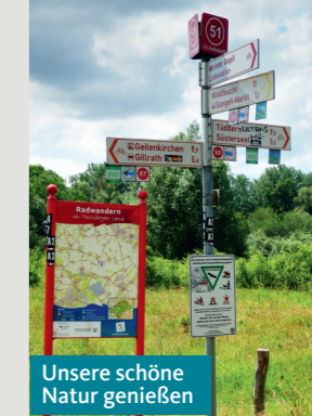
Unsere schöne Natur genießen