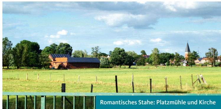
Romantisches Stahe: Platzmühle und Kirche