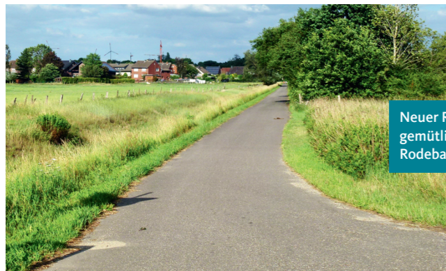
Neuer Radweg am gemütlichen Rodebach