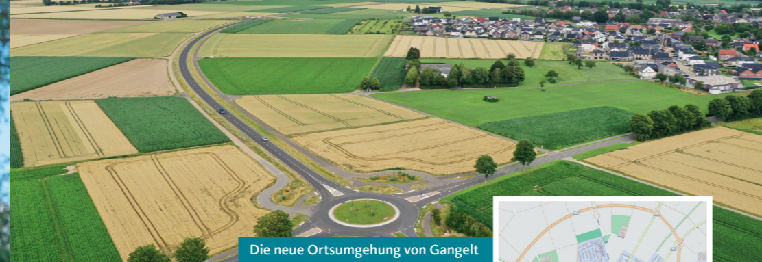
Die neue Ortsumgehung von Gangelt